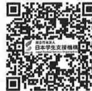
獨立行政法人 日本學生支援機構 JASSO