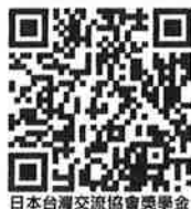
日本台灣交流協會獎學金